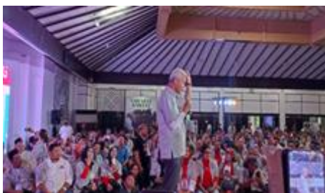
Gambar 9

Sementara itu, pada acara pidato Ganjar mengenakan pakaian hitam bukan pakaian hitam putih yang telah dikenalkan ke publik sebagai pakaian relawan selama berkampanye dapat dimaknai bahwa Ganjar pada saat itu berbeda haluan politik dengan Jokowi. Makna tersebut dapat ditelusuri berdasarkan berita bahwa pada 19 Juli 2023 Ganjar menyebut bahwa pakaian hitam putih yang akan dikenakan selama kampanye adalah hasil desain Jokowi (Antaraneews.com, 2023). Pakaian hitam putih yang dikenalkan sebelumnya dapat dilihat pada gambar 9.